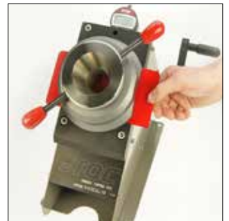
Test de embutición