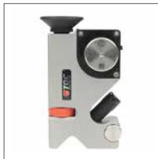
Superpig medidor destructivo de espesores de recubrimiento