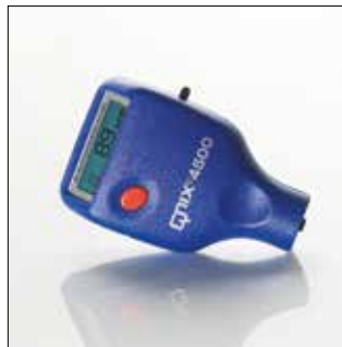
QNIX4500, imprescindible en toda línea de pintura. Simple y funcional (1 botón)