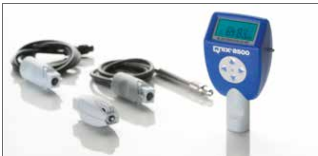
QNIX8500 con software y diferentes sondas según necesidades