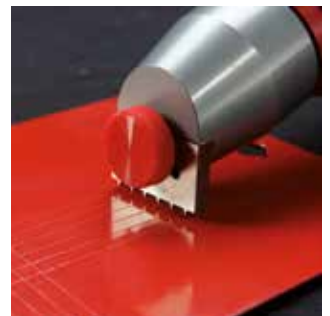
Test de rayas cruzadas