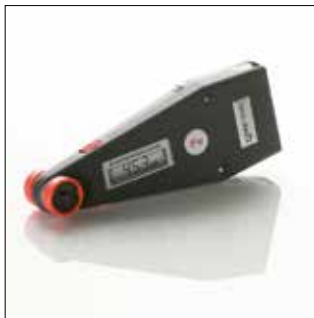
QNIX1500, hasta 5.000 micras en Fe/NFe